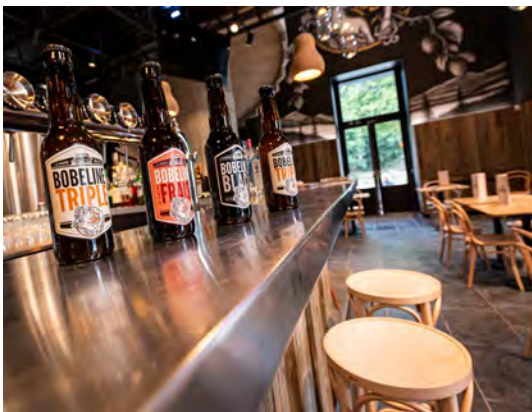
Spa Brasserie Bobeline

• Et aussi des organisateurs d'activités de qualité Weventures tout comme Adrenaline Events vous propose la création de teambuilding indoor ou outdoor sur mesure toujours innovant, mêlant l'aventure et la cohésion d'équipe et ce dans toute la province de Liège !