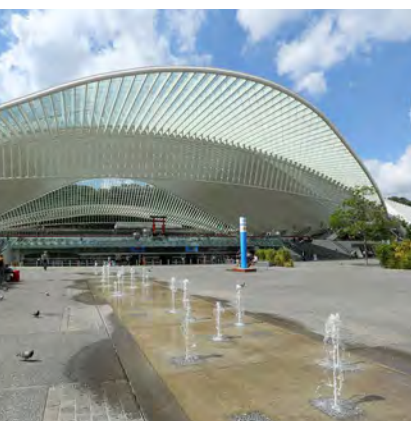
© Gare SNCB de Liège-Guillemins-Arch. Ing Santiago CALATRAVA

D'autres lieux s'offrent également à vous : Blegny-Mine , l'Abbaye du Val Dieu, la Ferme Saint-Lambert , FLYIN (le simulateur de chute libre), ou encore, le Fort Aventure de Chaudfontaine.