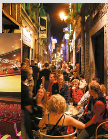
Le Carré