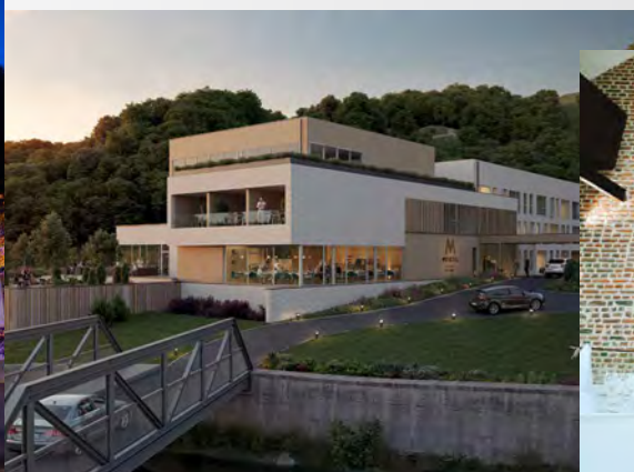
Malmédy My Hôtel Intermills