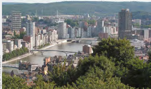
Vue sur Liège