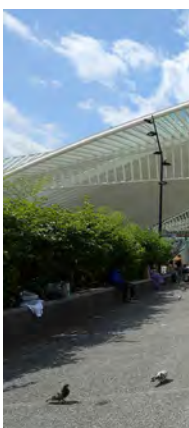
Liège Gare Guillemins