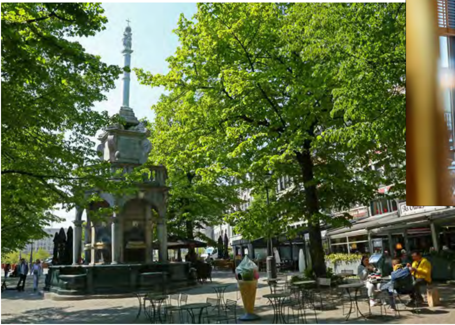
Liège place du Marché - Le Perron