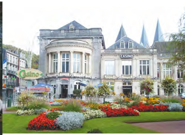
Spa - Le Casino