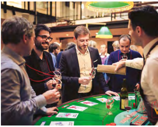
Liege Ready Steady Cinerea VINI VEGAS