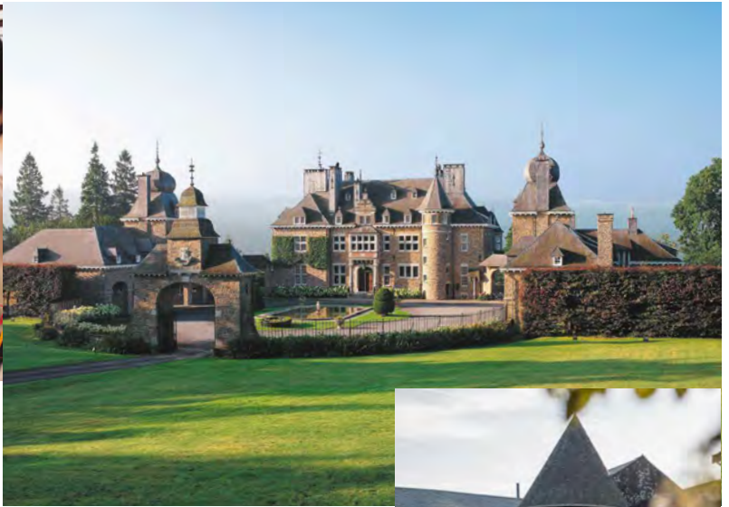
Spa - le Manoir de Lébioles