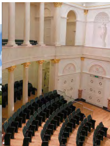
ULG - salle académique