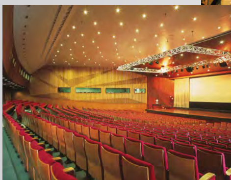
© Palais des Congrès - salle de l'Europe

Découvrez, avec l'aide précieuse du Convention Bureau, les nombreux prestataires actifs sur le territoire !