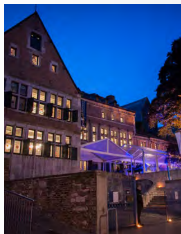
Liège Bocholtz