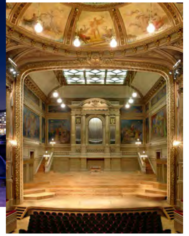
Salle Philharmonique de Liège