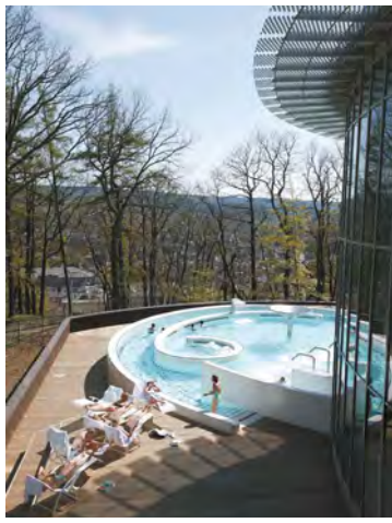
Les Thermes de Spa