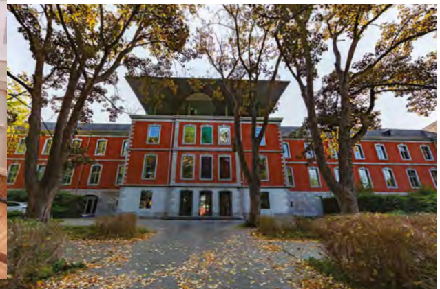
Seraing Chateau Val Saint Lambert Abbaye