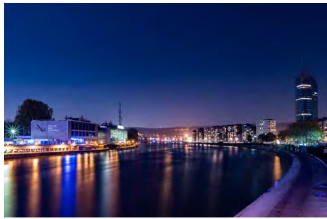
Palais des Congrès