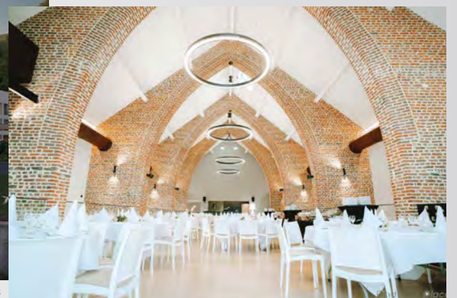
Amay Ferme Saint Lambert 06723