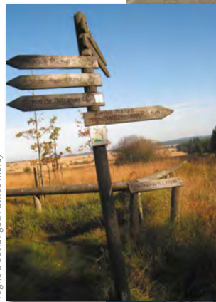
Fagne à Botrange