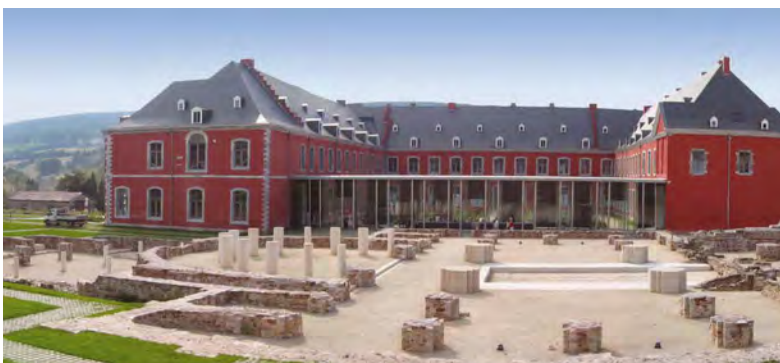
Abbaye de Stavelot © « Abbaye de Stavelot »

Pour tout type d'organisation, avec son magnifique jardin du cloître , ses trois musées de niveau international , ses salles prestigieuses, ses caves séculaires, l'Abbaye de Stavelot est à n'en pas douter la destination plaisir.