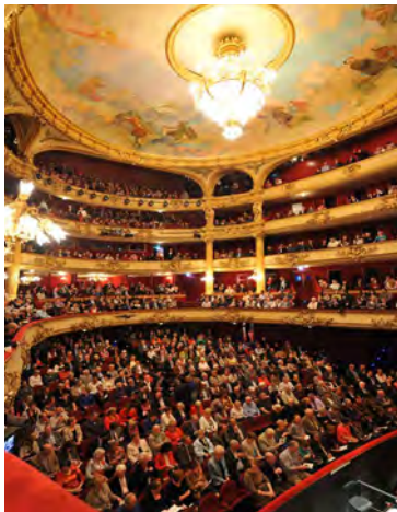
© Jacques Croisier - Opéra Royal de Wallonie Liège